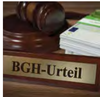
Starkes Urteil für Versicherte.

Bei einem Widerruf erhalten Sie – anders als bei der Kündigung – alle eingezahlten Beiträge ohne Abzug von Maklerprovisionen und Verwaltungskosten zurück. Und nicht nur das: Die Versicherung muss Sie auch an dem mit Ihrem Geld erzielten Anlagegewinn beteiligen. So können Sie bis zu 150 % der eingezahlten Beiträge zurückholen. Ein sattes Plus auf Ihrem Konto winkt!