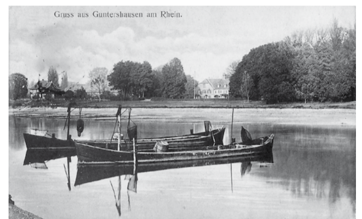
Altrhein bei Stockstadt am Rhein mit dem Hofgut Guntershausen um 1910.