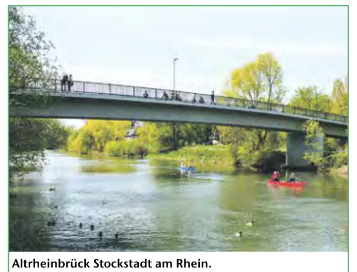
Altrheinbrück Stockstadt am Rhein.

Baby-Massage für Kinder von 6 Wochen bis 4 Monate startet ab 19. Juni 2023 mit sechs Terminen immer montags von 10.45 bis 11.30 Uhr Anmeldungen zu den Babykursen sind über www.m-a-z.org möglich. MAZ