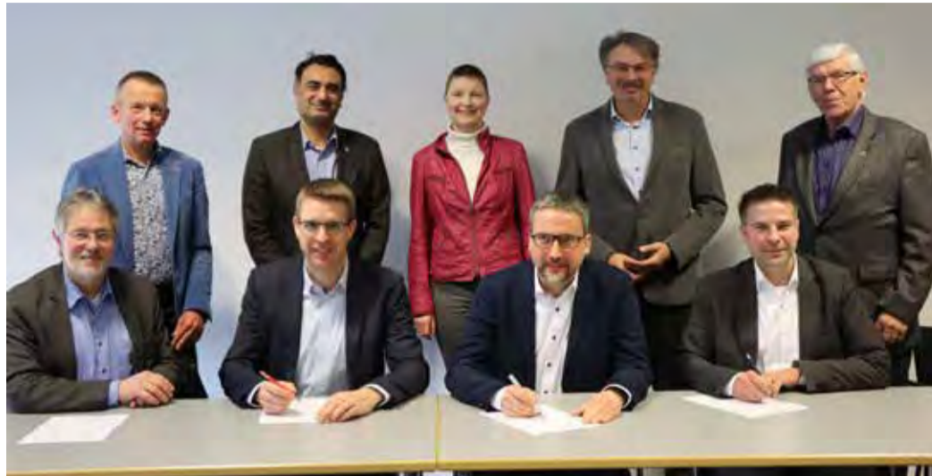
Zusammenarbeit bei der Überwachung des Gaststättenrechts - Bürgermeister und Verantwortliche der IKZ-Lenkungsgruppe im Kreis Groß-Gerau bei der Vertragsunterzeichnung

KREIS GROSS-GERAU – Seit 2013 arbeiten die 14 Städte und Gemeinden des Kreises Groß-Gerau und der Kreis Groß-Gerau in einem zentral gesteuerten Prozess zusammen, um die interkommunale Kooperation im Kreisgebiet systematisch auszubauen. Auf zahlreichen Aufgabenfeldern haben seitdem interkommunale Projekte stattgefunden, die zur Bildung dauerhafter Kooperationen führten. Dieses gemeinschaftliche Vorgehen hat die Leistungskraft der Kommunen gestärkt und erhebliche Einsparungen für ihre Haushalte ermöglicht.