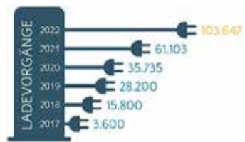
Entwicklung der Ladevorgänge an den geförderten ENTEGA-Ladesäulen

Darüber hinaus zeigt die kostenlose „Easy Charging Quality“-App alle Ladeoptionen in der Nähe des aktuellen Standorts an und kann ebenfalls zum Laden an allen ENTEGA-Ladesäulen genutzt werden. Die App gibt außerdem tagesaktuelle Auskunft über sämtliche Konditionen an den Ladepunkten der ENTEGA-Roamingpartner. Hier können die Preise im Vergleich zu den Konditionen an den ENTEGA-Ladesäulen abweichen. PM