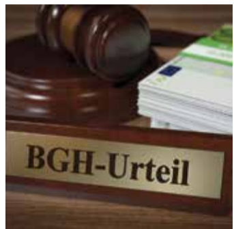
Starkes Urteil für Versicherte.

Bei einem Widerruf erhalten Sie – anders als bei der Kündigung – alle eingezahlten Beiträge ohne Abzug von Maklerprovisionen und Verwaltungskosten zurück. Und nicht nur das: Die Versicherung muss Sie auch an dem mit Ihrem Geld erzielten Anlagegewinn beteiligen. So können Sie bis zu 150 % der eingezahlten Beiträge zurückholen. Ein sattes Plus auf Ihrem Konto winkt!