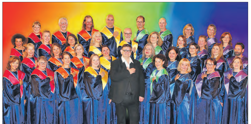
Rainbow Gospel & Soul Connection.