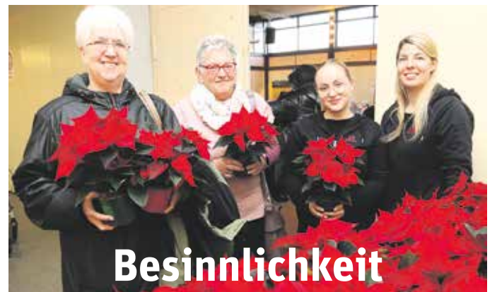
Gefallen hat es diesen Besuchern der Seniorenweihnachtsfeier.