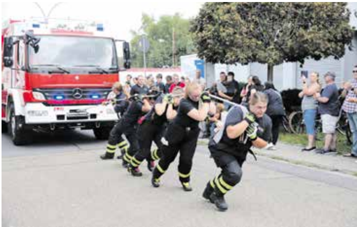
Frauteam unserer Feuerwehr Wettkampf Feuerwehrauto ziehen.