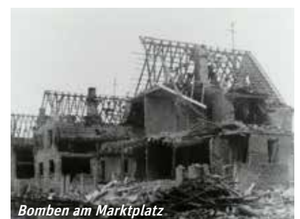
Bomben am Marktplatz