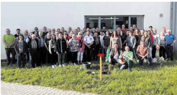
Besuch der Feuerwehr Ellerbek; gemeinsames Pflanzen eines Maibaumes hinter dem Feuerwehrhaus