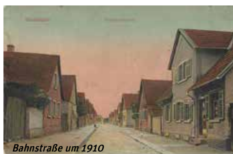
Bahnstraße um 1910