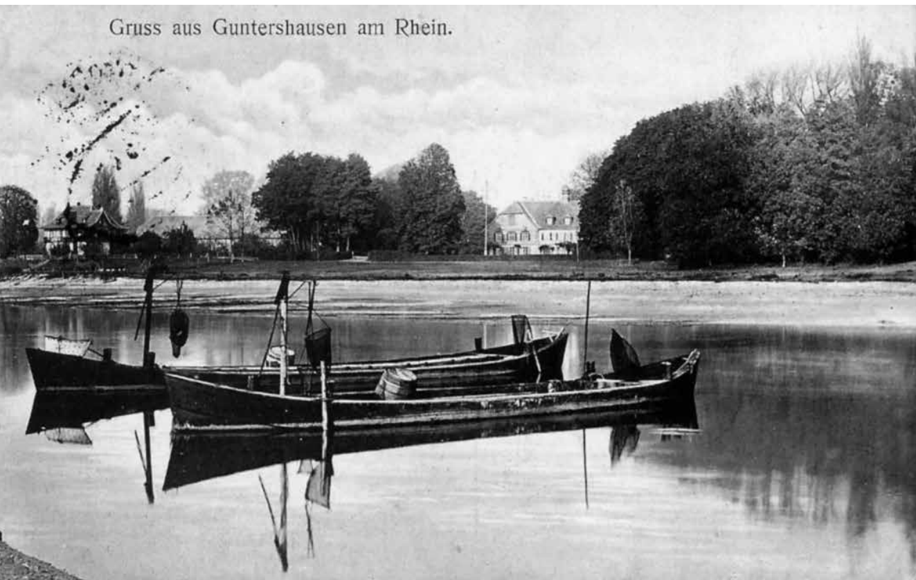
Gruss aus Guntershausen am Rhein.

sein. Bereits 1585 wird ein Schulmeister aus Erfelden genannt, der bis 1598 im Obergeschoss des 1537 erbauten Rathauses Unterricht hielt. Anders als in umliegenden Orten verfügte die Stockstädter Pfarrei über umfangreichen Grundbesitz und damit Finanzmittel. Daher waren hier bis 1789 ausschließlich studierte Theologen und Schulmeister beschäftigt. Aufgrund steigender Schülerzahlen wurde 1840/41 in der Oberstraße ein Schulgebäude erstellt. Ende des 19. Jahrhunderts war es wieder zu klein, daher wurde 1906 ein neues Gebäude neben der evangelischen Kirche eingeweiht. 1949 besuchten 510 Kinder die Schule.