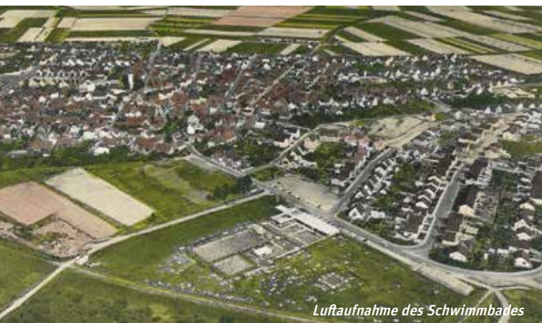
Luftaufnahme des Schwimmbades